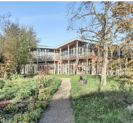
Co-housing Wijk&Co is een mooi voorbeeld van intergenerationeel samenwonen. De groene omgeving, gedeelde ruimtes en het sociale netwerk maken van Wijk&Co een thuis voor iedereen.

Er zijn reeds prikkelende buitenlandse voorbeelden, zoals de Abbeyfieldhuizen in Engeland (sinds 2013 ook in Wallonië en 2023 in Vlaanderen), Tubbehuizen in Scandinavië en 't Knarrenhof in Nederland. Wij laten ons inspireren door deze modellen en nemen dit mee in het ontwerp.