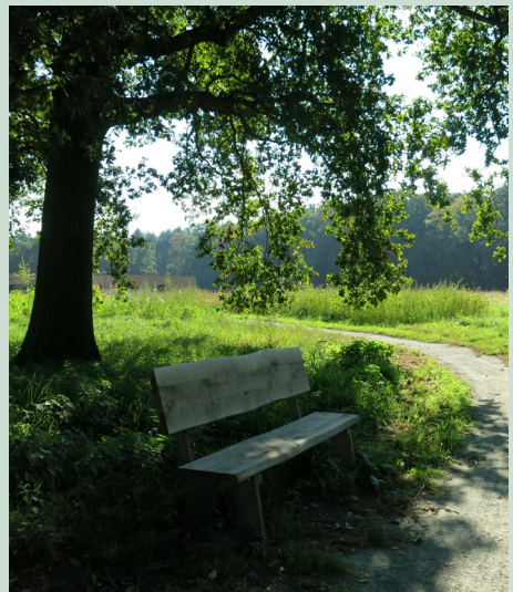
Nieuwe paden en zitbanken zorgen voor een aangename wandelroute.

Woonzorgcentrum De Mick is een zorgcluster in de bossen van Brasschaat. Met de steun van het project Buitenzorg van de regionale landschappen hebben zij de buitenruimte getransformeerd naar een aangename en prikkelende tuin met voor ieder wat wils (Frank Van Baelen, Regionaal Landschap de Voorkepen). Natuurbeleving staat centraal. De tuin die voorheen een grasvlakte was, is omgetoverd tot een veld met bomen, struiken, bloemen en wadi's verbonden door slingerende paden. Er is een dwaaltuin ingericht waar bewoners met dementie zelfstandig kunnen rondlopen. De Mickhoeve wordt ingericht als zorgboerderij. Tot slot is de er een speelbos ingericht voor kinderen. Met deze positieve veranderingen probeert De Mick haar bewoners en de zorg terug meer buiten te krijgen.