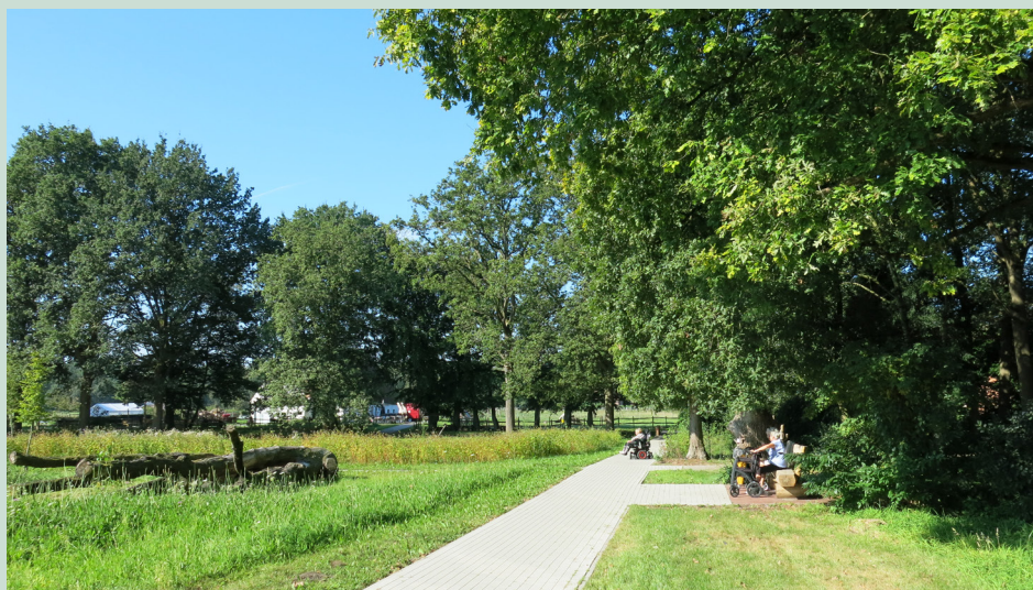
Bewoners genieten van de zon. Voor hun ligt een oude zomereik waar kinderen op kunnen klauteren.