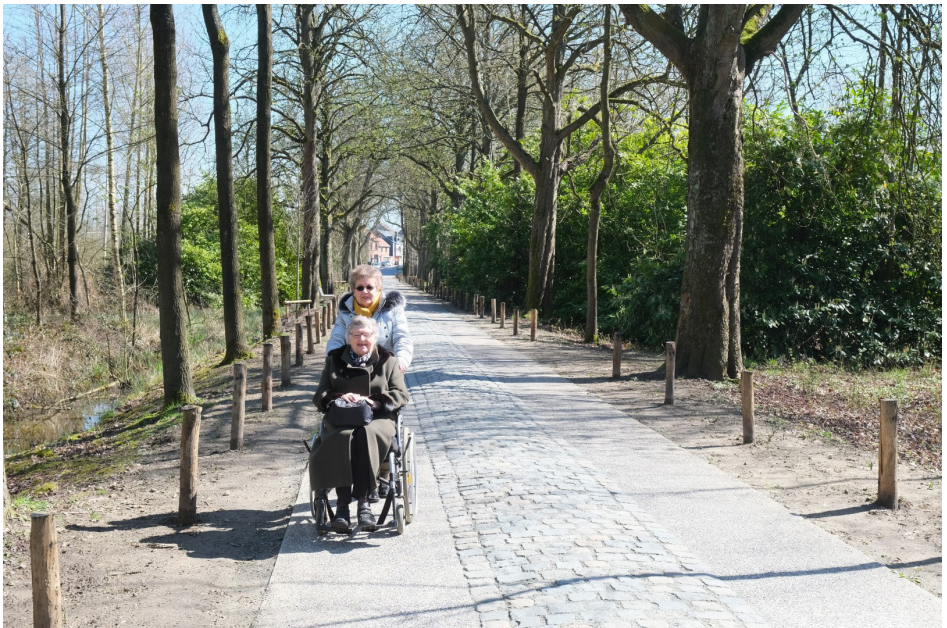
Twee oudere dames genieten van een zonnige lentewandeling op de recent heraangelegde kasteeldreef in Bornem. Door zorgzaam te ontwerpen is dit een route die iedereen graag gebruikt.

Stramien maakt ruimte, voor ouderen, voor iedereen.