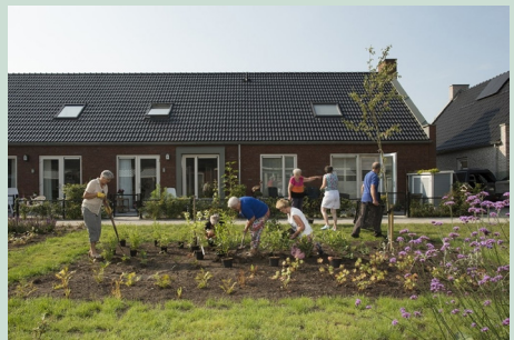
Ouderen klussen samen, wat het werk lichter en plezieriger maakt

Deze manier van ontwerpen schept evenwaardige mogelijkheden voor alle gebruikers en verhoogt de levenskwaliteit voor iedereen. Het beklemtoont een meer inclusieve creatieve benadering door van bij de aanvang van elk ontwerpproces de vraag te stellen: hoe kan een gebouw of publieke ruimte zo aangenaam en functioneel mogelijk zijn voor de grootst mogelijke groep van potentiële gebruikers? Ontwerpen van Stramien zijn daarom aantrekkelijk, toegankelijk en bruikbaar voor een grote diversiteit aan mensen, waaronder ouderen.