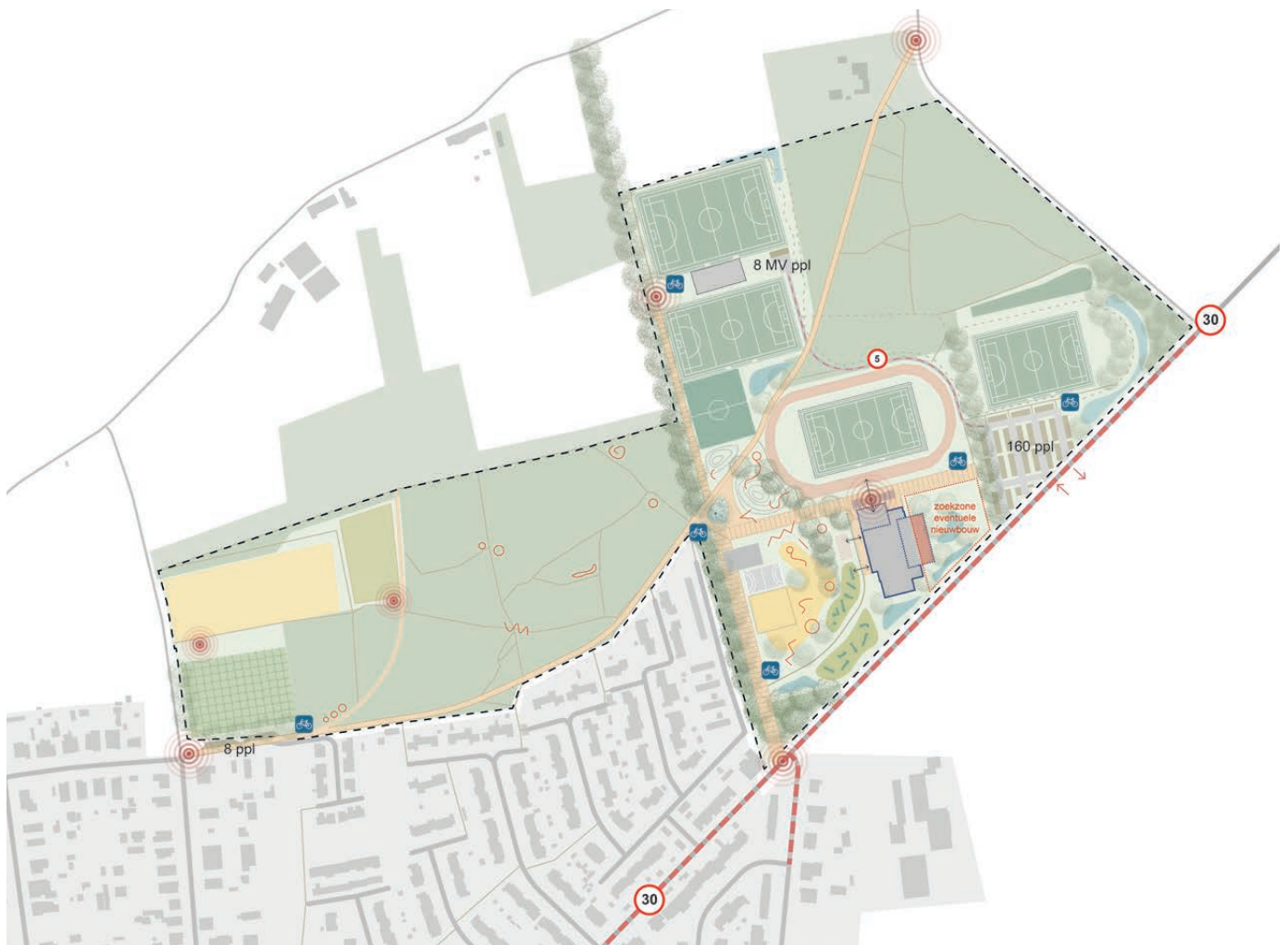
Scenario onderzoek - inrichtingsvoorstel op lange termijn

Tussen de kern van Herenthout en het open landschap ligt het sportpark 't Kapelleke. Zowel indoor als outdoor zijn hier heel wat Herenthoutse clubs actief. Het sportpark werd recent uitgebreid met een zone voor de voetbalploeg KFC Herenthout. Er duiken de laatste jaren een aantal knelpunten op. De site is moeilijk leesbaar geworden en de infrastructuur verouderd en onderbenut. Het doel van dit masterplan is om een langetermijnvisie te ontwikkelen die de site sterk maakt voor de toekomst. Er wordt onder meer ingezet op het verhogen van het ruimtelijk rendement, gedeeld en meervoudig ruimtegebruik, klimaatbestendigheid, herkenbaarheid, leesbaarheid en het sterker inkantelen van de site in het dorp.