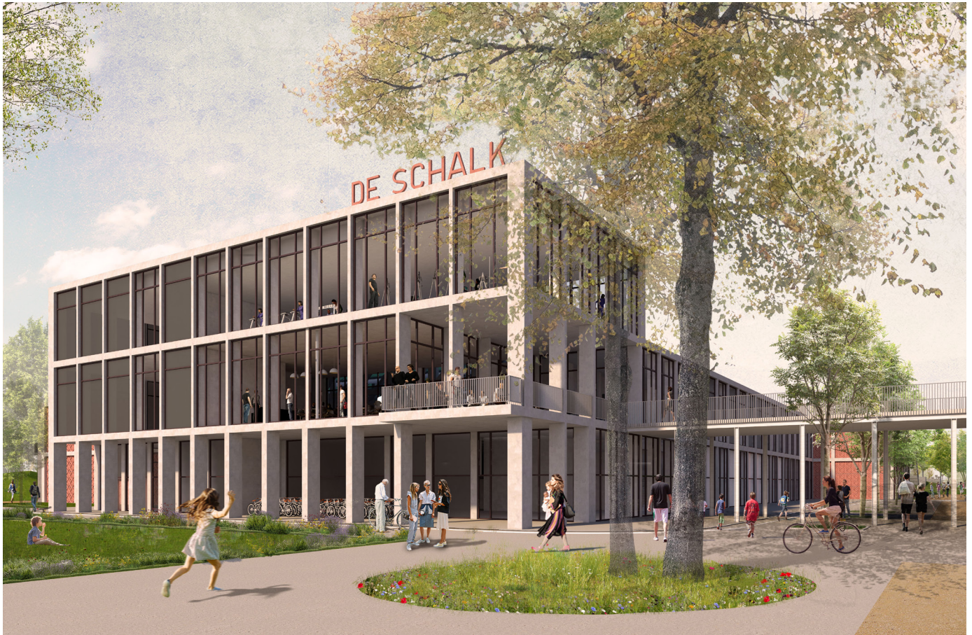
Zicht op nieuwe inkomzone van De Schalk

In het najaar van 2021 zal fase 1.1 van site De Schalk voltooid zijn. Deze omvat de bouw van een omnisportgebouw enerzijds, een bko en kribbe anderzijds, alsook de directe omgevingsaanleg. Dit alles kadert binnen het overkoepelend Masterplan Huis van de Vrije Tijd dat in 2017 door Stramien werd opgemaakt. Fase 1.2 vormt dan ook het sluitstuk, een kans om site De Schalk op een geïntegreerde manier te vervolledigen, waarbij de verschillende gebouwen en hun omgeving in directe dialoog gaan. De betrachting was steeds om van De Schalk een sportcampus te maken met bovenlokale uitstraling.