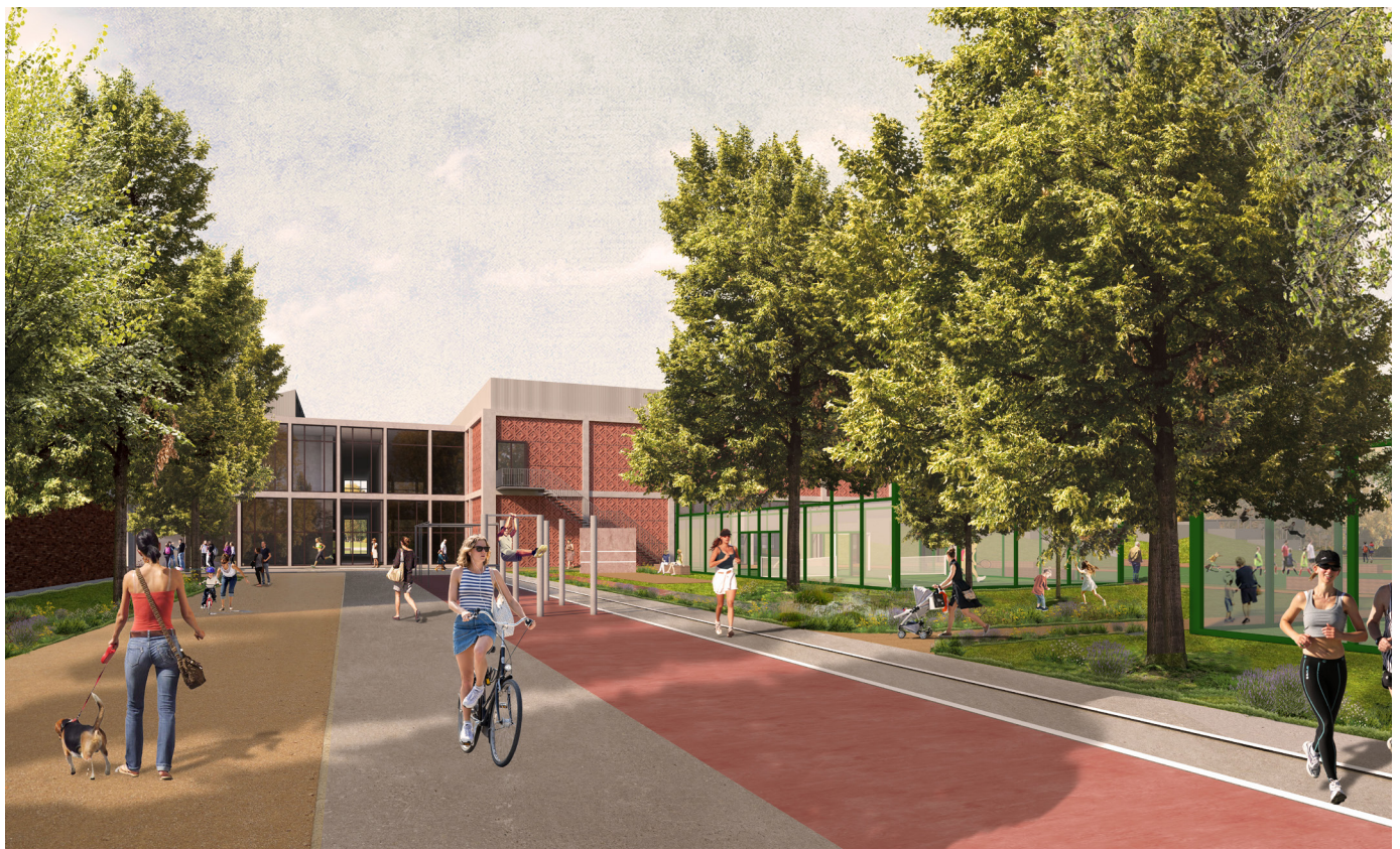
De centrale Sportstrip koppelt op eenduidige manier binnen- en buitenfuncties overzichtelijk aan mekaar.