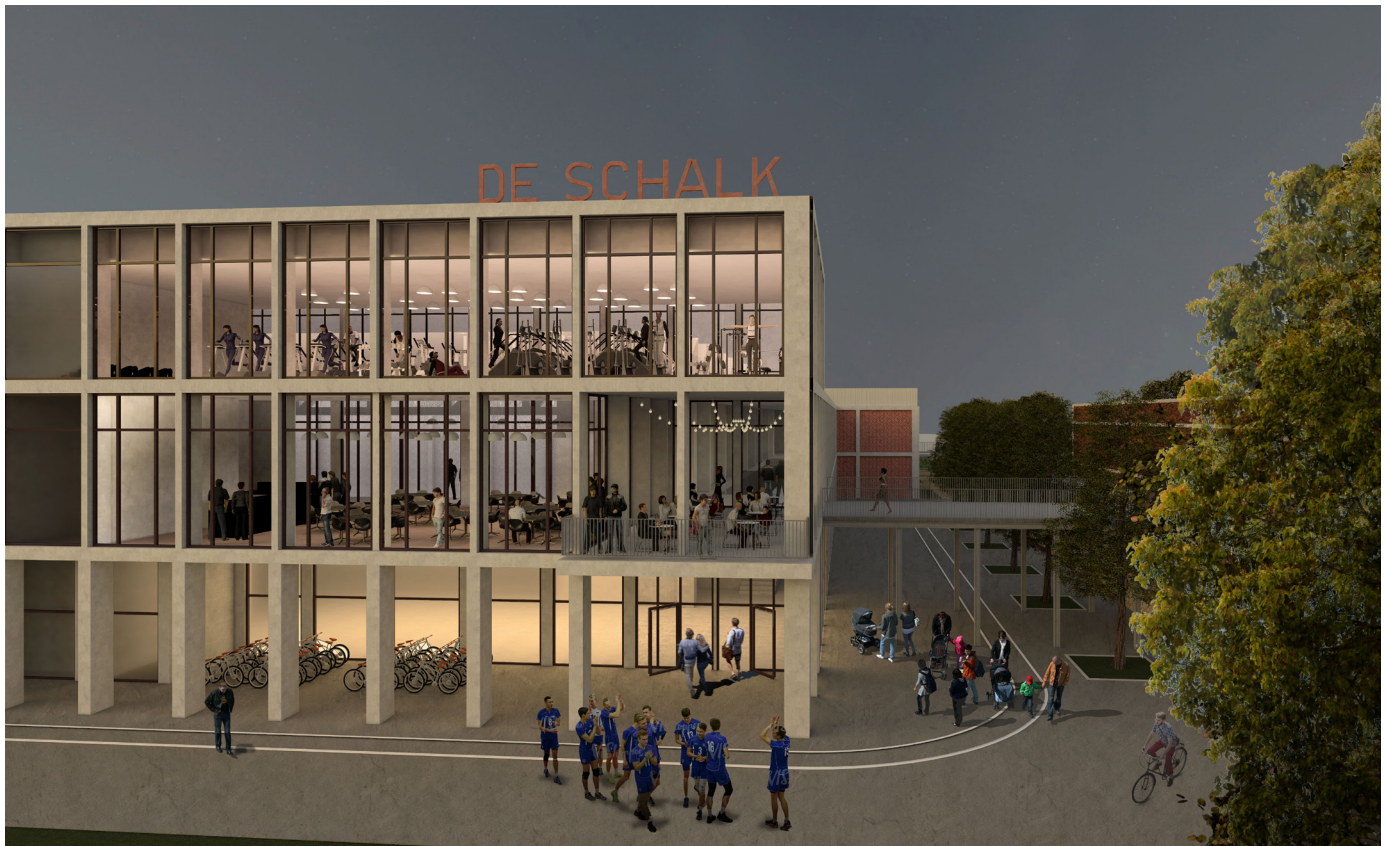
De Schalk is een levendig gebouw. Onthaal, Cafetaria en Fitness tonen de dynamiek aan alle bezoekers en voorbijgangers.