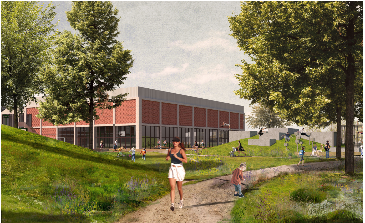
Zicht op de Parkzaal. De Schalk zet in op een sterke beleving en directe relatie tussen binnen en buiten.